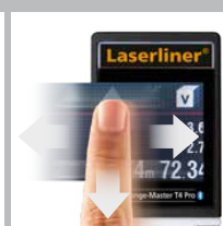
Pantalla táctil para cambiar las funciones