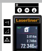
Con varias opciones