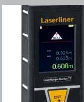
Pantalla LC en color con iluminación

* Véase precisiones específicas por sectores en el manual de instrucciones.